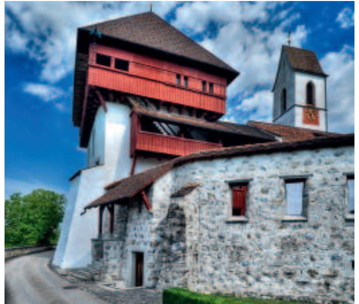
Frisch herausgeputzt und barrierefrei zugänglich bis unters Dach: Der Turm Roten nach der Sanierung.